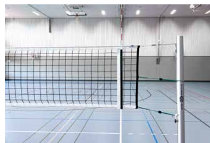
Filet de compétition avec antennes