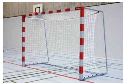
But de compétition