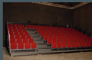
Théâtre Mummenschanz Espace Nuithonie Villars-sur-Glâne

Gradins combinés pour 3 ou 4 sièges par plateaux pour diverses configurations.