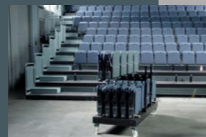
Théâtre Populaire Romand TPR La Chaux-de-Fonds

Gradins aux possibilités multiples de montage, jusqu'à une hauteur de 3,20 m.