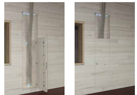
Niche murale avec porte de fermeture